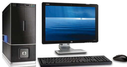
Figure 1. Un ordinateur de bureau

Pour comprendre le cloud précisément, nous devons d'abord avoir une vision claire de ce qu'est un serveur. Un serveur est tout simplement un ordinateur dépourvu de tout ce qui n'est pas essentiel (écran, souris, carte graphique, carte son, clavier) ... Pour illustrer ceci: lorsque Google calcule quels sont les meilleurs résultats pour votre recherche "restaurant bon marché et délicieux à Lyon", ce calcul doit être fait sur un ordinateur, n'est-ce pas? Le type d'ordinateur utilisé pour faire ce calcul n'est pas celui-ci: